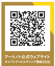
アートノト公式ウェブサイト キャパシティビルディング講座2026

※2 受講生となった方のショートレポートは、受講の際に講座内で講師及び他の受講生と共有する機会がある旨を予めご了承ください。