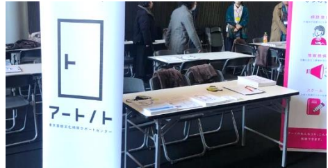
令和6年1月「ART JOB FAIR」内での出張相談の様子

[令和5年度対応件数] 351件（内、出張相談68件） ※開設期間：令和5年10月2日～令和6年3月29日